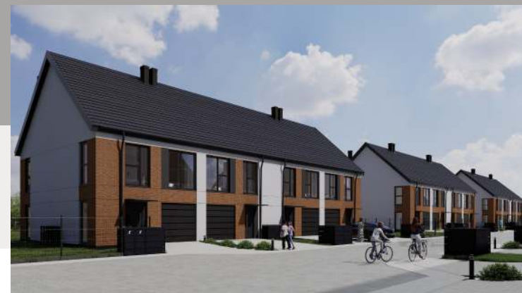
Widok od strony ulicy