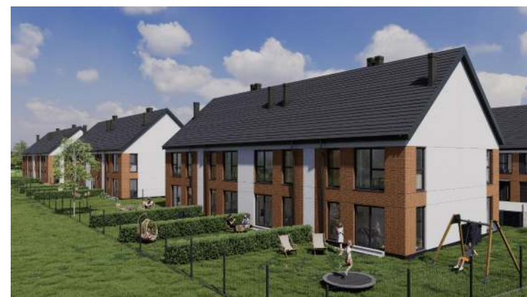
Widok od strony ogrodu